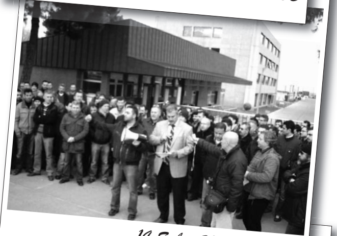
14 Şubat 2011 | Prysmian