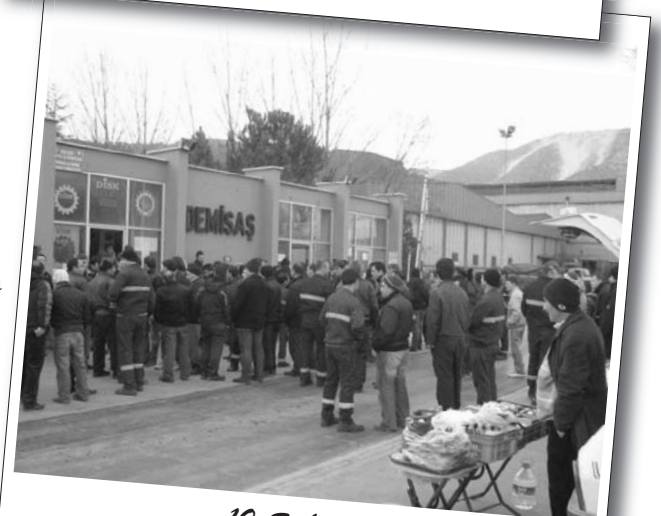
10 Şubat Perşembe | Demisas