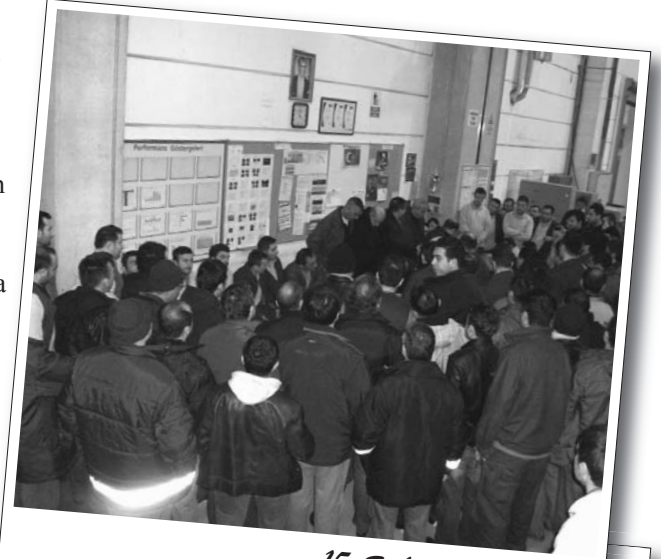
15 Şubat 2011 | ABB

Ardından fabrika içerisinde bulunan sendika panosuna grev kararını astılar. İşçiler toplu halde üretim alanından çıkarak servislere bindiler.