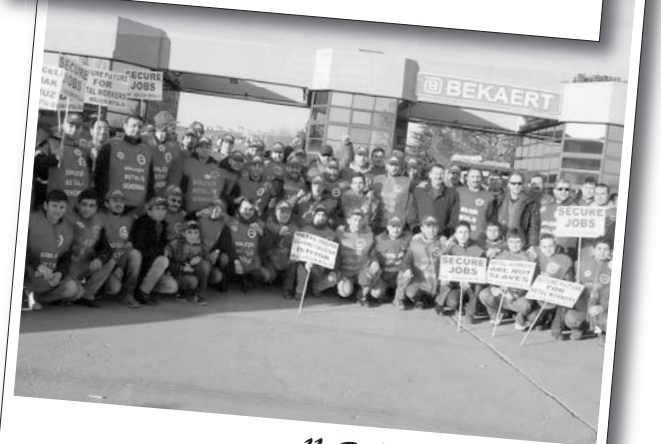
11 Şubat 2011 | Bekaert